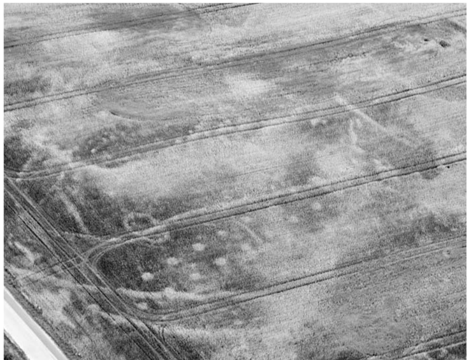
Luftfoto: Fra denne vinkel ses stolpehullerne tydeligt som hvide pletter af den vestligste bygning.

Tegningen er fra 1901 af Th. Hansen efter maleritegning fra 1796.