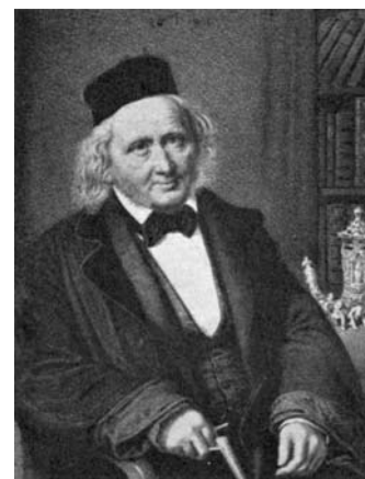
B. S. Ingemann - efter maleri af W. Marstrand

Og dette er endda kun en begyndelse. Dersom vi tager vores Gudstro alvorligt, må vi følge Betlehemsbarnet i dets opvækst og i dets senere voksenliv, helt