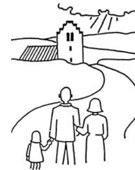
Kirken er din. - Brug den!

Hvad nytter det, at vi de senere år har høstet en masse viden på f.eks. IT-området, og at vi opfinder stadig mere avancerede computersystemer, når vi ikke