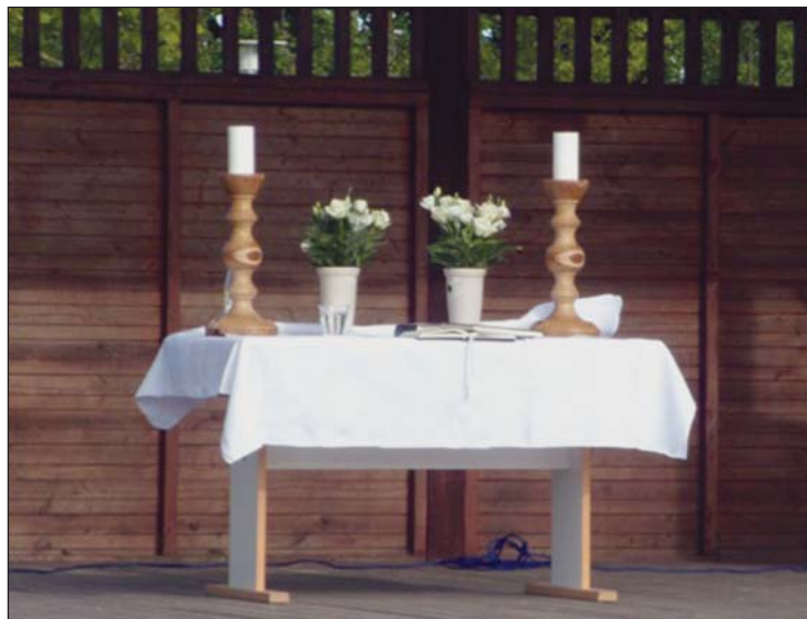
Friluftsalteret med de nye, flotte stager

På denne dejlige aften var også Klejtrup Kirkes to nye alterstager i brug for første gang. Trædrejerne i Klejtrup har foræret Klejtrup menighedsråd to nye alterstager drejet i træ.