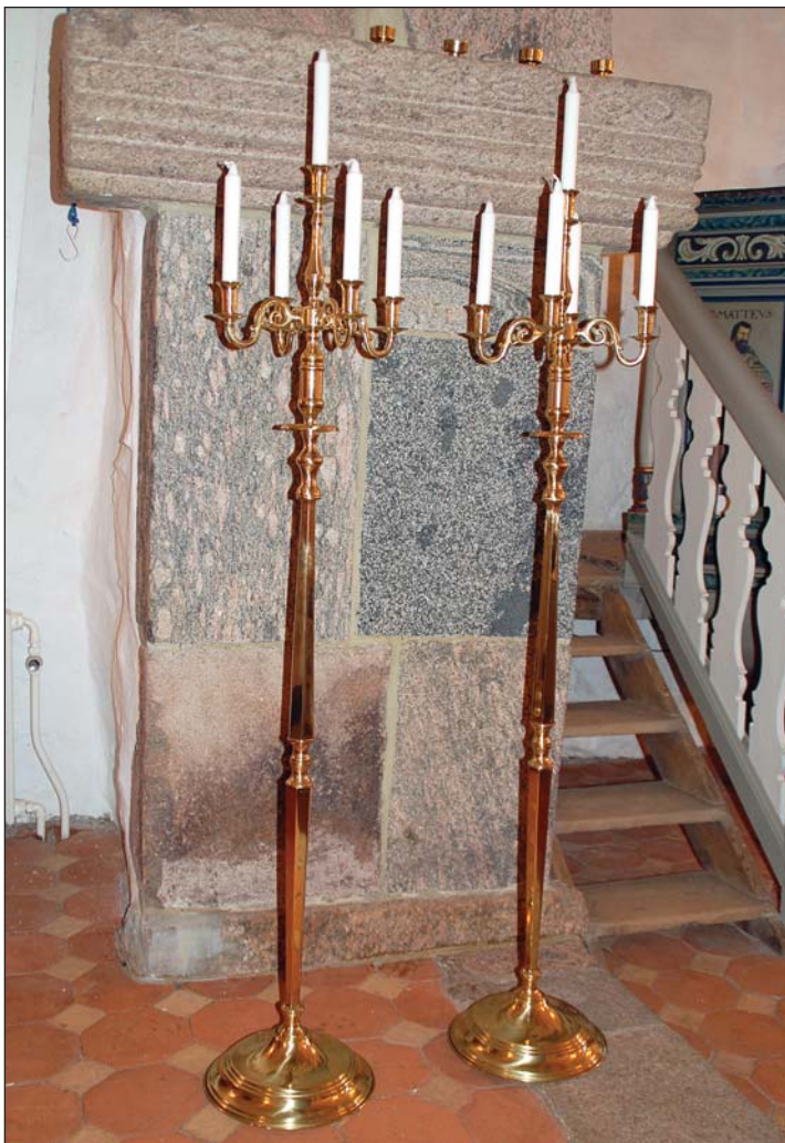
Kandelaberne - i V.Bjerregrav Kirke