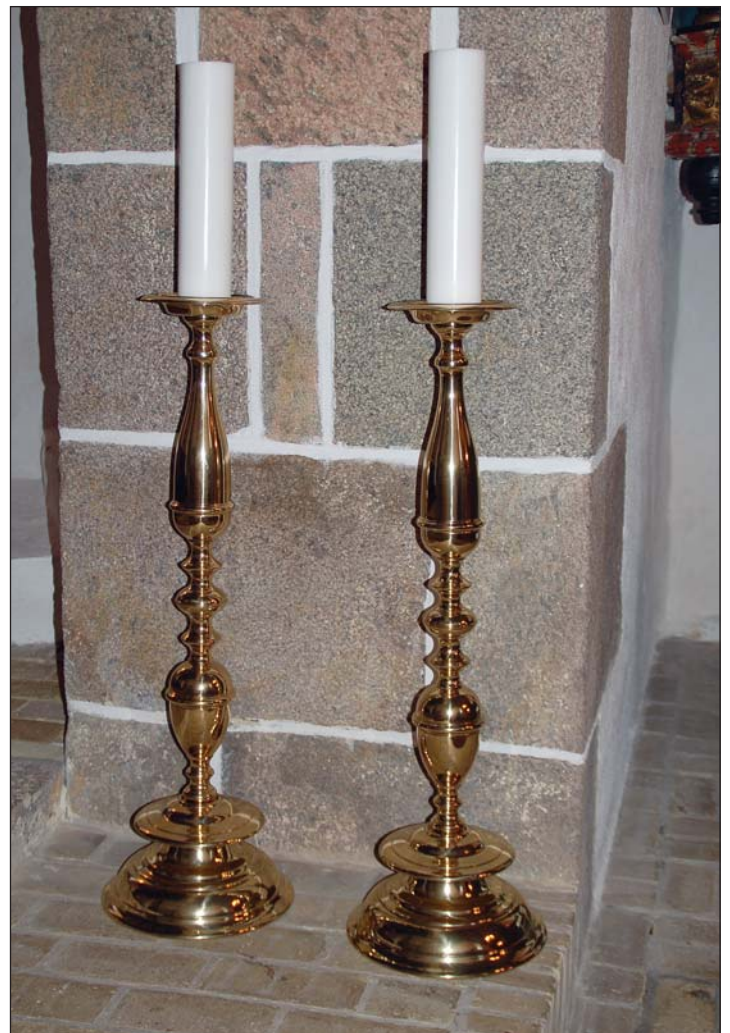
Kandelaberne - i Hersom Kirke