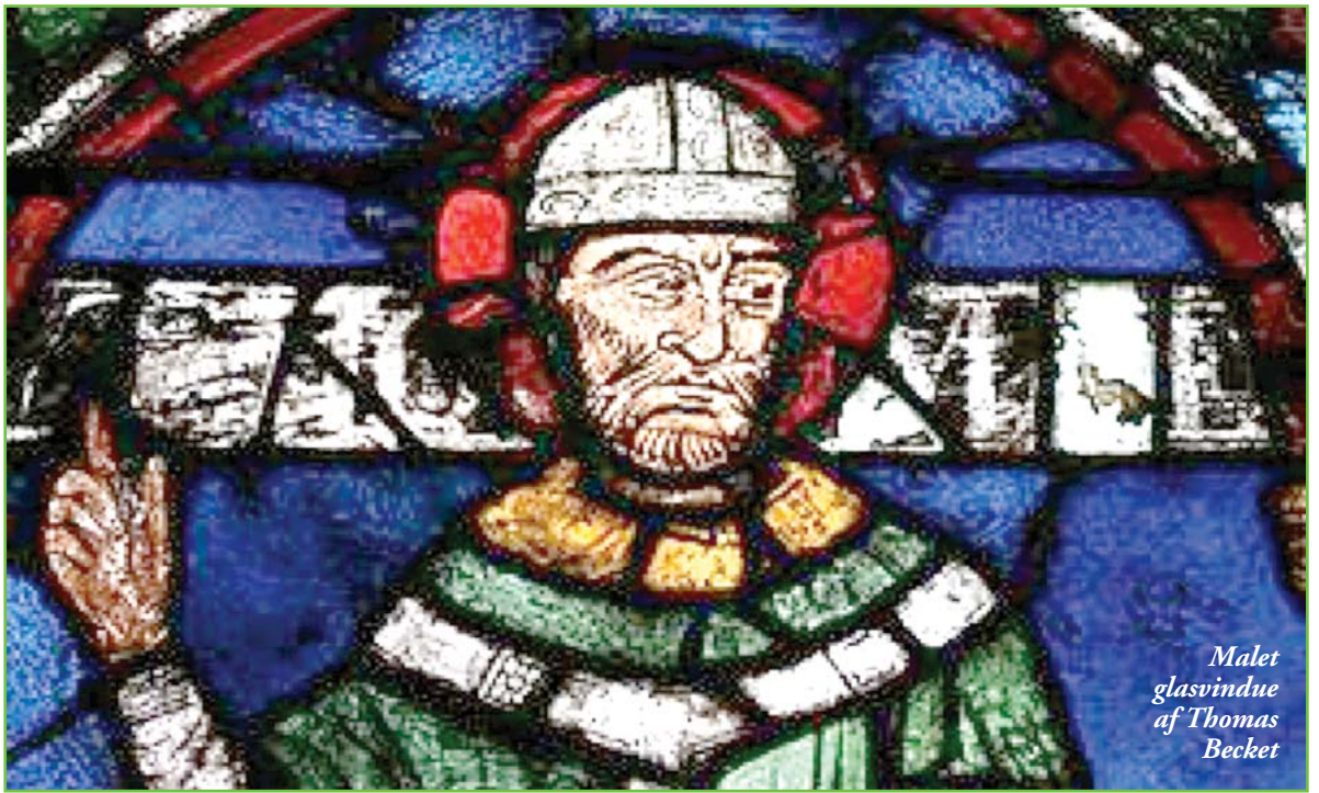
Malet glasvindu af Thomas Becket

Selv om nogle af disse markedsføringskampag-