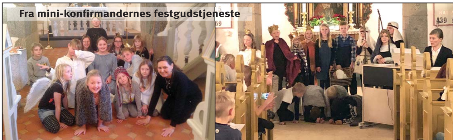
Fra mini-konfirmandernes festgudstjeneste