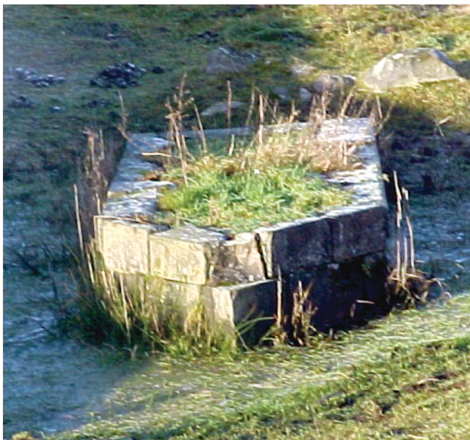
Bropille ved Løvelbro tilspidset mod strømmen, så dravis let kunne passere

Det har været et fantastisk byggeri. Broen har været 14 meter lang og har hvilet på to strømpiller som den frigravede. Den har derved haft tre runde buer til vandgennemløb og en vejdæmning i begge sider, som skulle føre over de sumpede områder til fast grund ca. 100 meter borte.