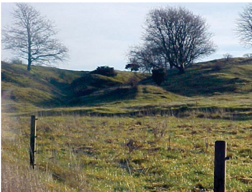
Hjulspor ved Pederstrup

spor eller stier, der var trådt af kvæget gennem mange kvægdrifter. Disse veje skar sig, ved mange fødders og kloves slid, dybt ned i terrænet og blev til dybe hulveje. Det kan man se et eksempel på, hvis man kigger mod øst (mod Pederstrup) lige når man har passeret Løvelbro mod Viborg. Her ses den ene hulvejsfordybning ved siden af den anden tydeligt i landskabet.